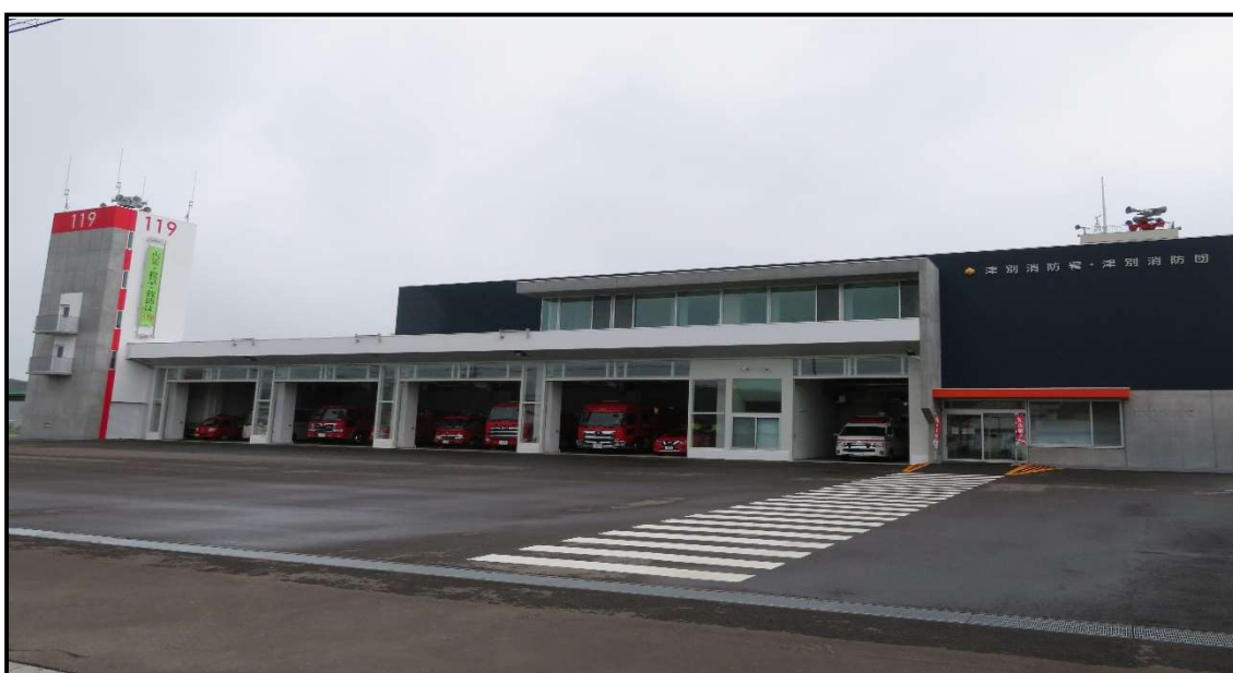
美幌・津別広域事務組合津別消防署 令和3年3月19日使用開始