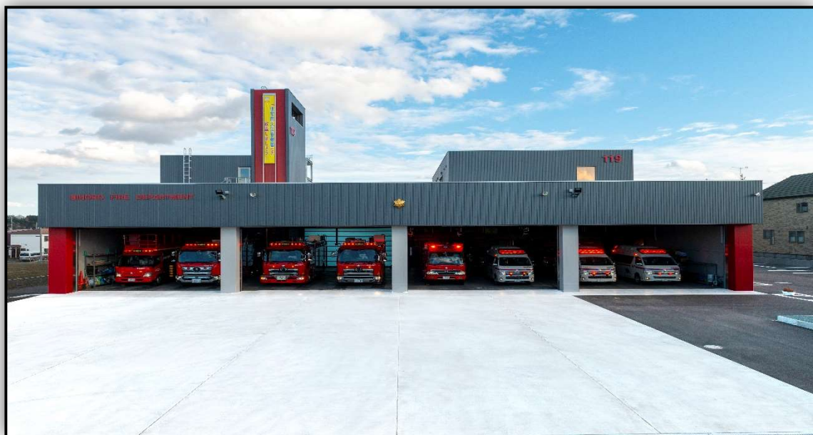
美幌・津別広域事務組合消防本部・美幌消防署 令和3年5月27日使用開始