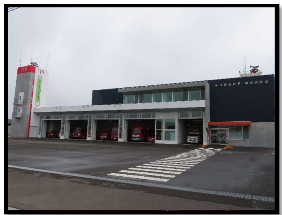
[ 津別消防署 ]