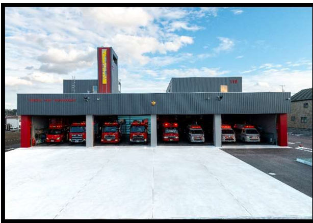
[ 消防本部・美幌消防署 ]

所在地 北海道網走郡津別町字新町1番地5 構造 鉄筋コンクリート造 2階建 建築面積 1026.76 m 2 延面積 1597.71 m 2 敷地面積 4,349.53 m 2 竣工 令和3年3月15日 TEL (0152) 76-2189 FAX (0152) 76-2190