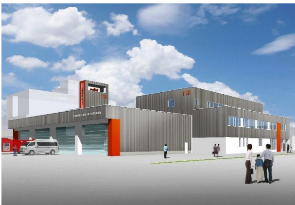
[ 消防本部・美幌消防署 ]

所在地 北海道網走郡津別町字新町1番地5 構造 鉄筋コンクリート造 2階建 建築面積 566.081 m 2 延面積 995.561 m 2 敷地面積 6,081.290 m 2 竣工 昭和47年9月30日 TEL（0152）76-2189 FAX（0152）76-2190