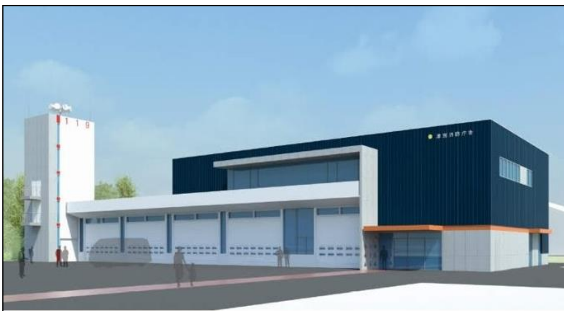
美幌・津別広域事務組合津別消防署 令和3年3月完成予定