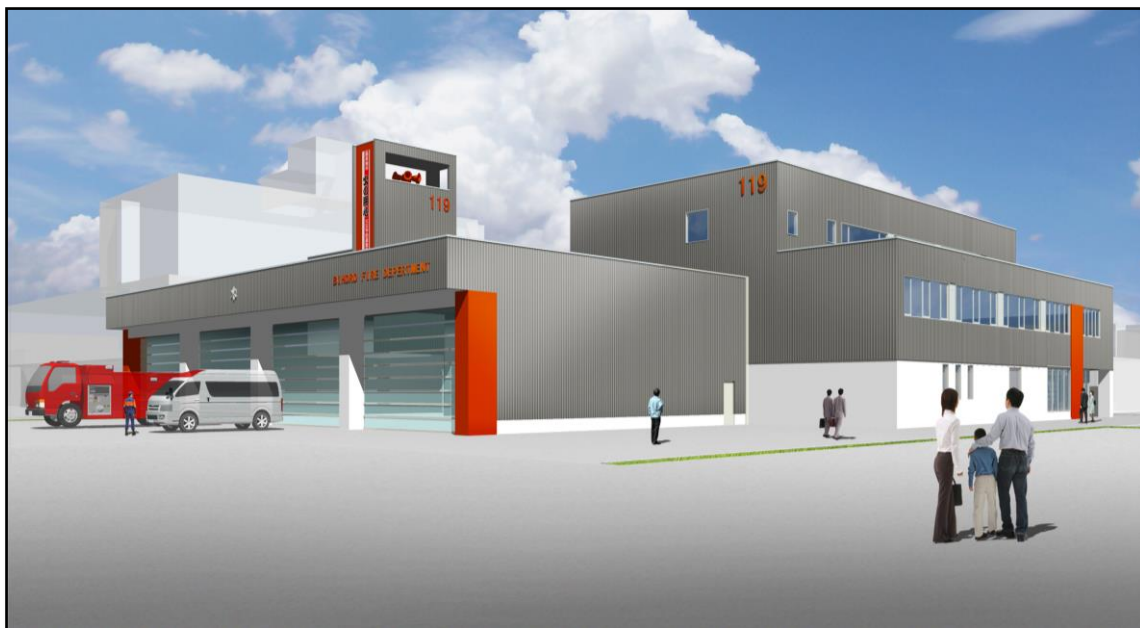
美幌・津別広域事務組合消防本部・美幌消防署 令和3年5月完成予定