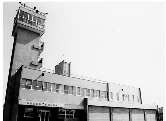
[ 津別消防署 ]