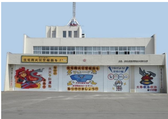
[ 消防本部・美幌消防署 ]

所在地 北海道網走郡津別町字新町1番地5 構造 鉄筋コンクリート造 2階建 建築面積 566.081 m 2 延面積 995.561 m 2 敷地面積 6,081.290 m 2 竣工 昭和47年9月30日 TEL (0152) 76-2189 FAX (0152) 76-2190