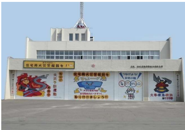
[ 消防本部・美幌消防署 ]

所在地 北海道網走郡津別町字新町1番地5 構造 鉄筋コンクリート造 2階建 建築面積 566.081 m 2 延面積 995.561 m 2 敷地面積 6,081.290 m 2 竣工 昭和47年9月30日 TEL (0152) 76-2189 FAX (0152) 76-2190