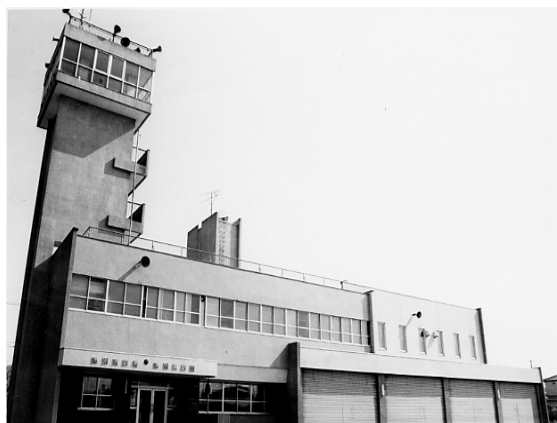
[ 津別消防署 ]