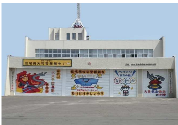
[ 消防本部・美幌消防署 ]

所在地 北海道網走郡津別町字新町1番地5 構造 鉄筋コンクリート造 2階建 建築面積 566.081 m 2 延面積 995.561 m 2 敷地面積 6,081.290 m 2 竣工 昭和47年9月30日 TEL (0152) 76-2189 FAX (0152) 76-2190