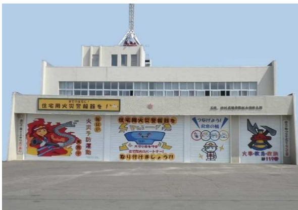
[ 消防本部・美幌消防署 ]

所在地 北海道網走郡津別町字新町1番地5 構造 鉄筋コンクリート造 2階建 建築面積 566.081 m 2 延面積 995.561 m 2 敷地面積 6,081.290 m 2 竣工 昭和47年9月30日 TEL (0152) 76-2189 FAX (0152) 76-2190